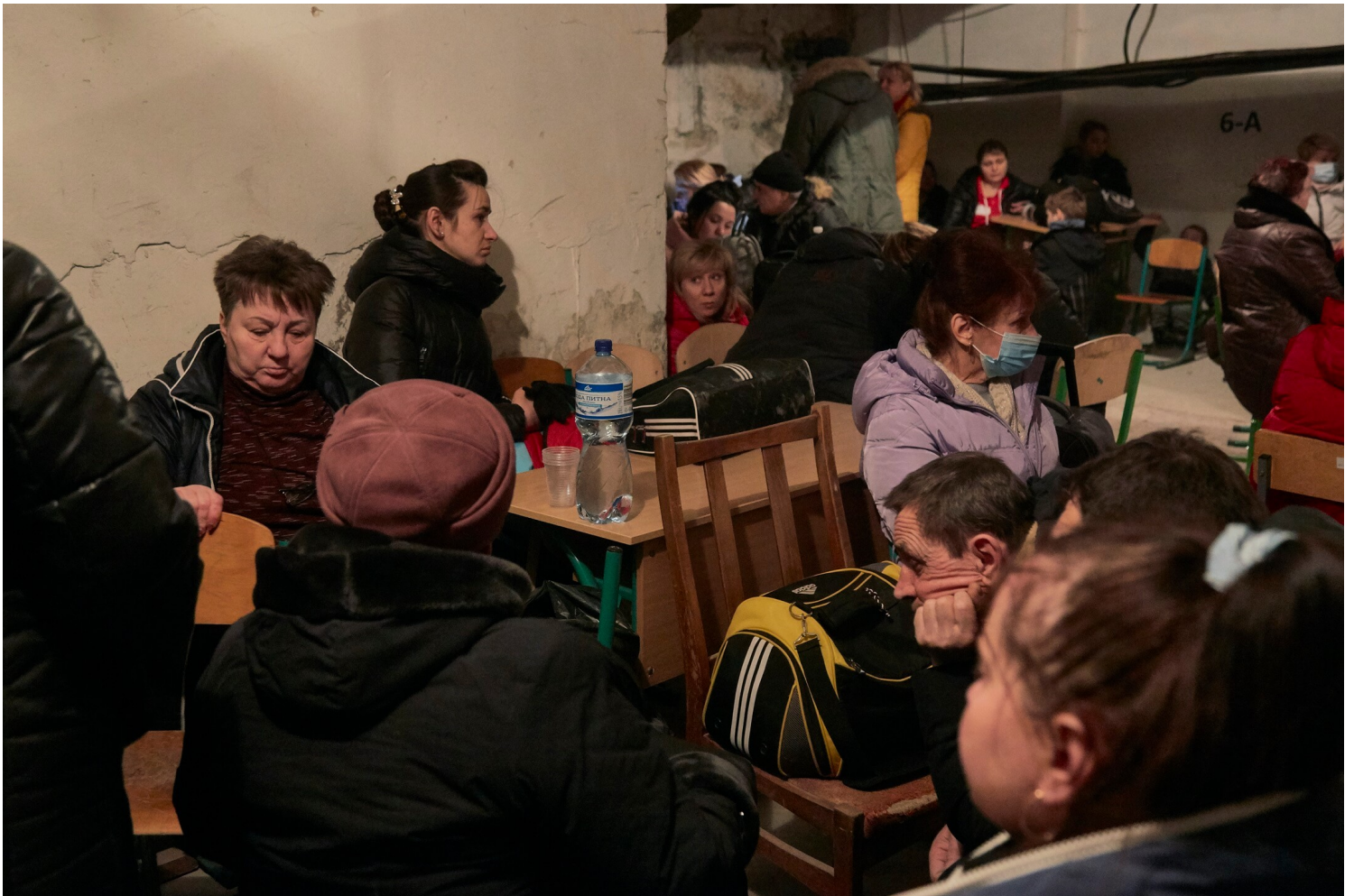
2022年2月25日，乌克兰首都基辅，俄罗斯发射炮弹摧毁民居，数百名因而流离失所的居民到一所在学校地牢的临时防空洞暂避。