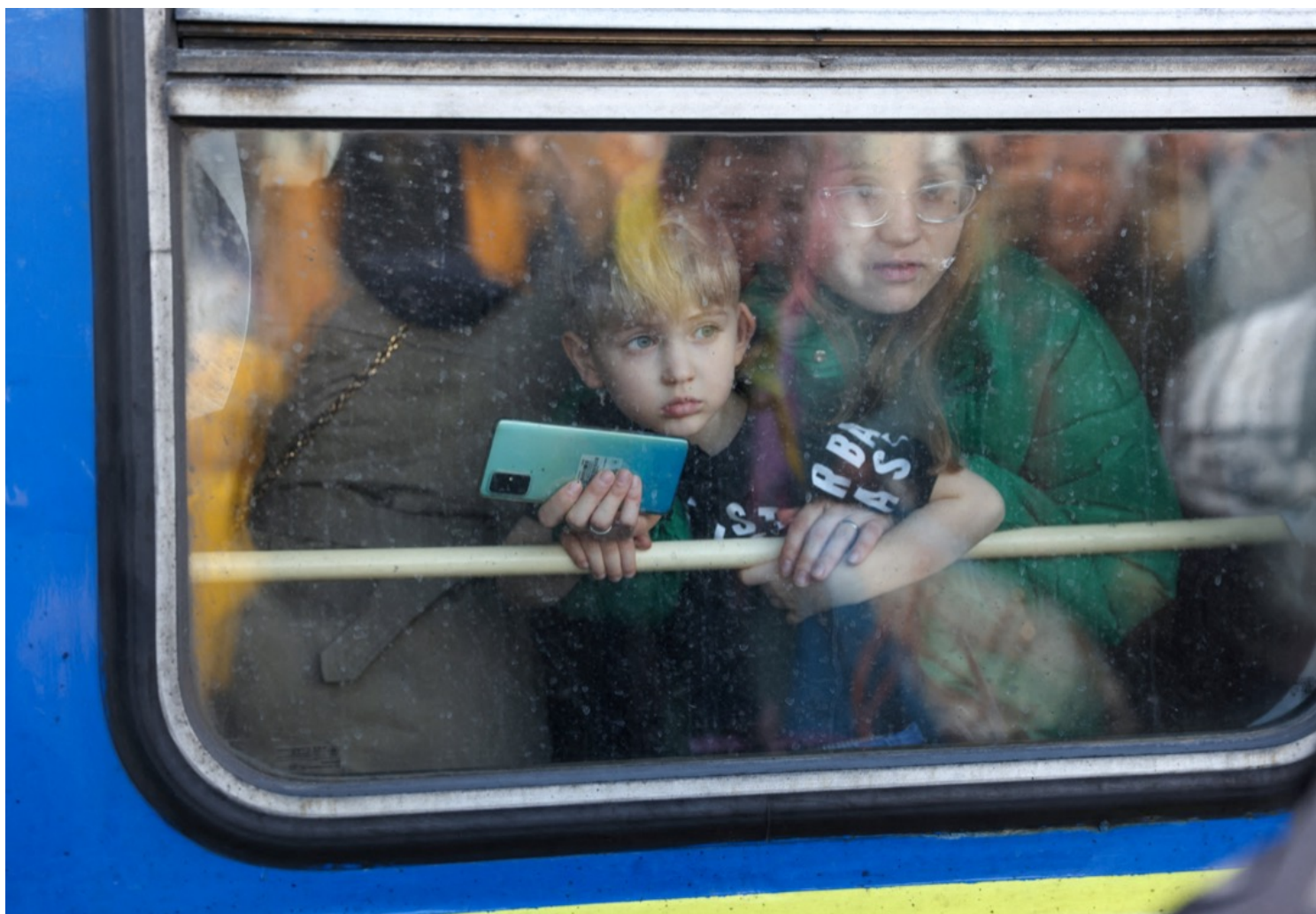
2022年2月25日，乌克兰首都基辅，民众在基辅中央火车站等候登上开往西部城市利沃夫的火车，逃避战难。