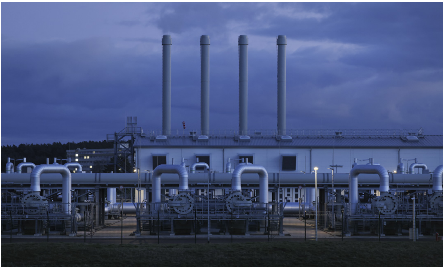
2022年2月2日，德國城市盧布明，北溪二號天然氣管道接收站。

不過24日俄羅斯以「特別軍事行動」之名，正式對烏開戰，打破一切可能，多國果斷發出強烈譴責，七國集團（G7）及歐盟緊急開會商討局勢。美國宣布再制裁更多俄羅斯銀行、寡頭，削弱俄羅斯高科技行業。歐盟亦將實施新制裁，包括限制其取得半導體等關鍵技術、對石油實施出口禁令、限制向俄羅斯航空公司出售飛機和設備，以及取消對俄羅斯外交人員和相關商界人士發出歐盟簽證。