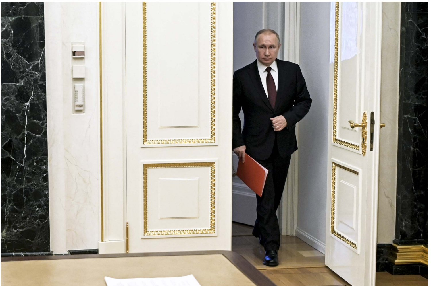
2022年2月25日，俄羅斯總統普京在俄羅斯莫斯科準備通過視頻與聯合國安理會成員開會。

《紐約時報》 指出 ，過去8年普京一直在努力重組俄羅斯的經濟，增強自身實力，減少對外依賴，以緩衝制裁帶來的衝擊。另據《華爾街日報》 報導 ，自2014年開始，俄羅斯利用石油和天然氣收入積累黃金和外匯儲備，若當制裁致使盧布貶值，上述儲備即可作為補充支撐，或用於政府開支。