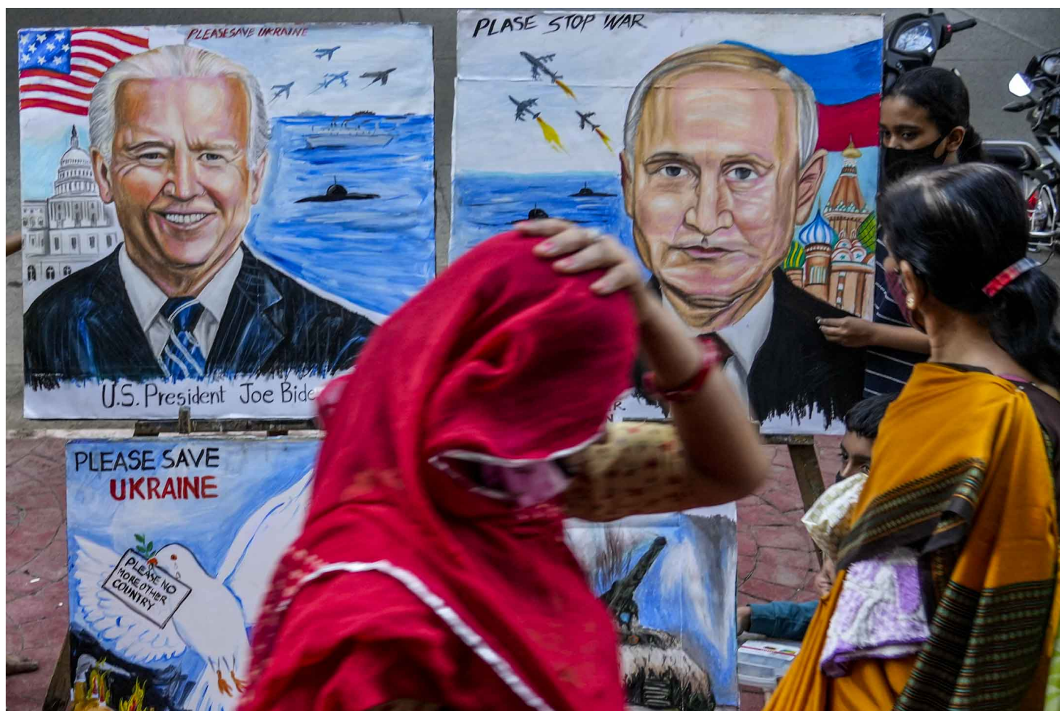
2022年2月21日，印度城市孟买，一名学生在展示她以“世界和平”为题所画的画。

俄罗斯发动战争，全球注视西方国家会否对俄罗斯采取更强硬态度，或甚出兵支援乌克兰。大家都在问：这些国家做了些甚么？