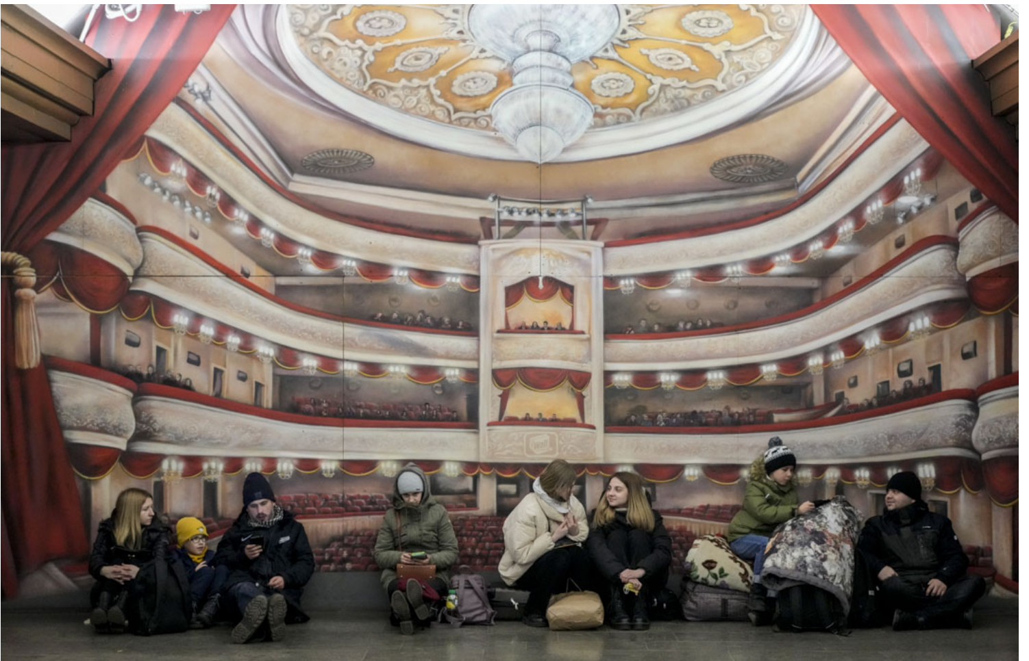
2022年2月25日，烏克蘭首都基輔，地鐵站成為臨時防空洞，民眾到內暫避。

迄今有30個成員國的北約於1949年成立，早期為對抗的蘇聯為首的東方集團軍事組織。冷戰結束後，北約逐漸轉型為現今的防衛性合作組織。根據北約創建時的《北大西洋公約》第4條規定：「當任何一個成員國認定其領土完整性、政治獨立或安全遭到威脅，全體成員國將進行協商。」2月24日的北約緊急會議，正是由波蘭及波羅的海三國，即立陶宛、拉脫維亞與愛沙尼亞，宣布援引第4條而發起。