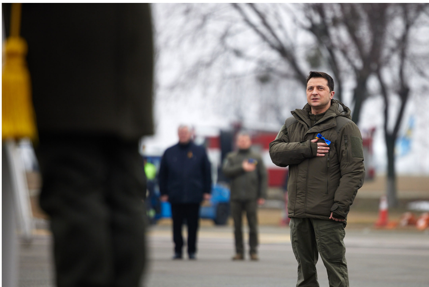
2022年2月16日乌克兰基辅，乌克兰总统泽连斯基出席了一个活动于乌克兰的统一日。

就在刚刚过去的周二（2月15日），俄罗斯总统普京在与德国总理舒尔茨会谈后表示，虽然美国和北约持续忽视俄罗斯的“核心安全关切”，他仍希望通过外交努力促成局势改善。与此同时，俄罗斯国防部宣布，部分完成演习的军队即将从俄乌边境挪回。这是几个月来俄军首次发出有意降级危机的信号。国际油价应声下落，主要股指亦开始反弹。资本市场对和平的期盼是殷切的，任何通向缓和的信息都会被充分地（如果不是过度地）参考。全球市场已然在全力招架COVID-19大流行与供应链堵塞带来的挑战。此时此刻，它最不需要的就是一场在东欧腹地点燃的巨大地缘政治危机。