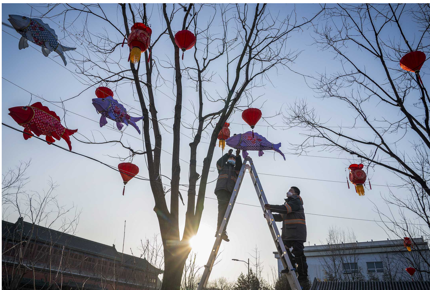
2022年1月29日北京，工人们于树上为即将到来的农历新年安装装饰品。

“希望自己喜欢的、关心的、还留在香港的人都能够平安。希望2022年结束时还可以有希望。”