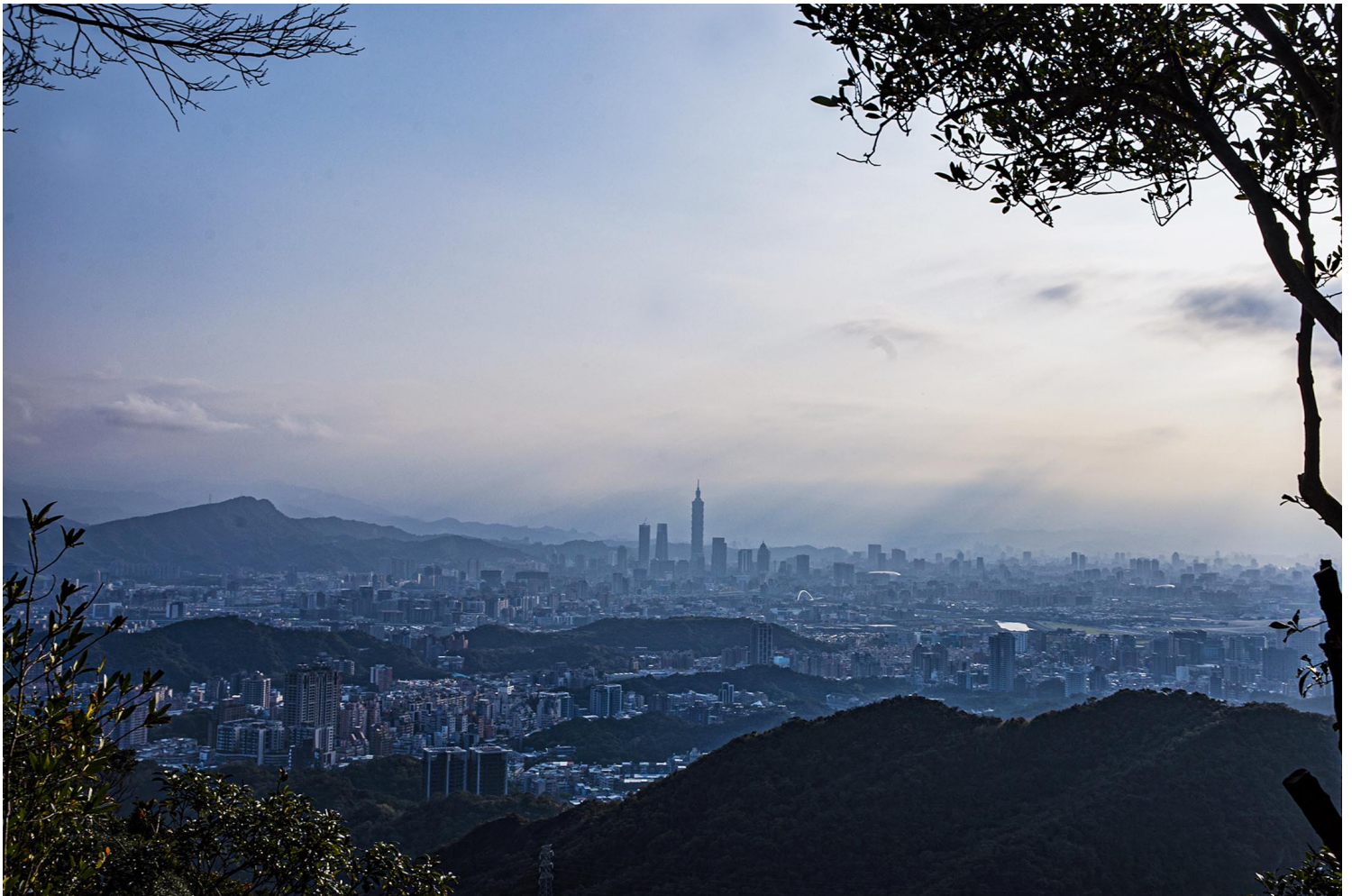
2022年1月16日，台北市。

期待这个国家能够走向文明，也许这条道路十分艰难，甚至在我有生之年都难以见证，但不去推动只会更加艰难。为了自己和下一代能够活得更有尊严，能做一点算一点，我愿意从自身做起，去尊重和包容身边那些少数群体，主动去关心那些公共事务，去帮助那些困难的人，甚至，从主动去扶一位摔倒的老人开始。