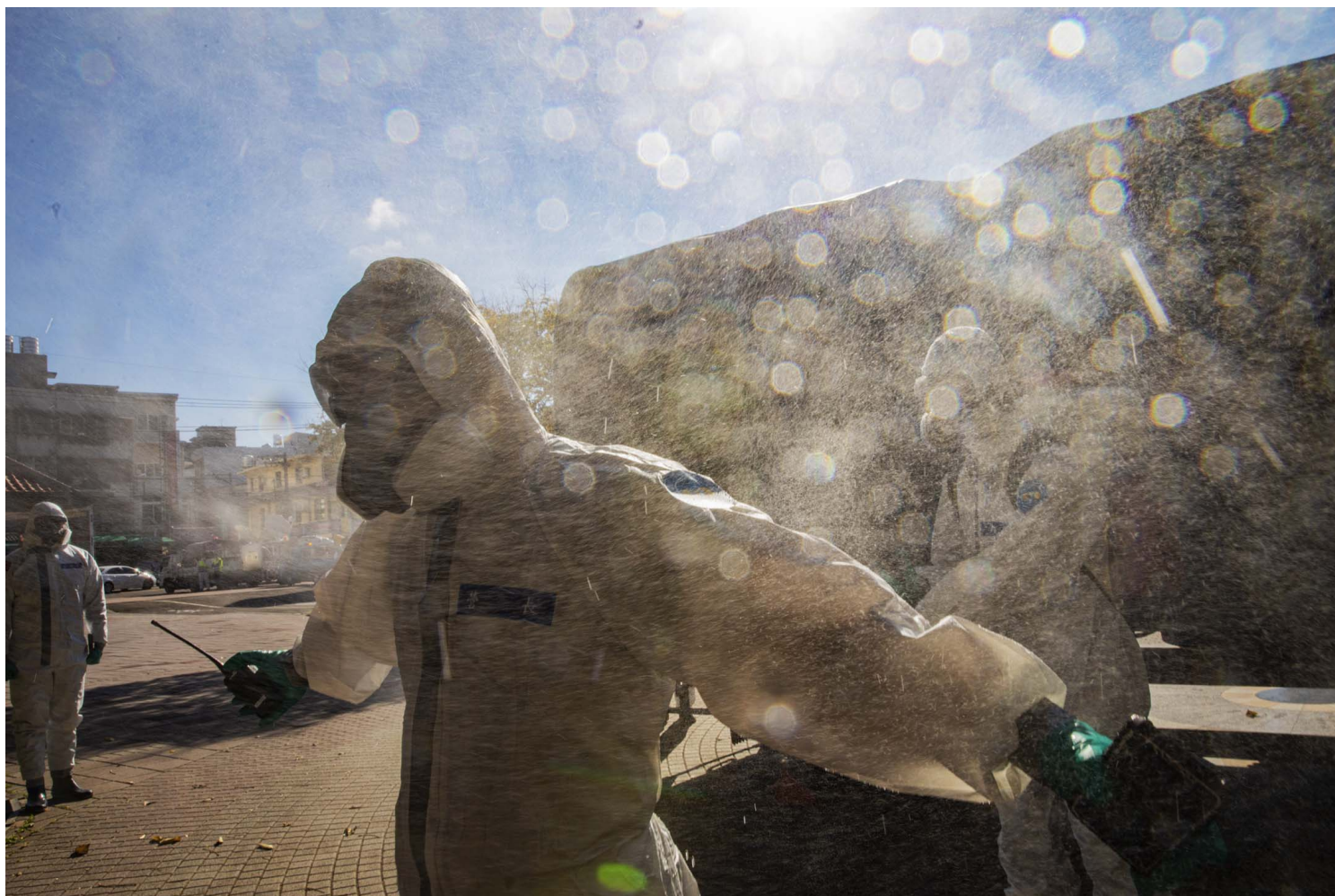
2022年1月4日台灣桃園市，工作人員在市場消毒後，清潔自己的身體。