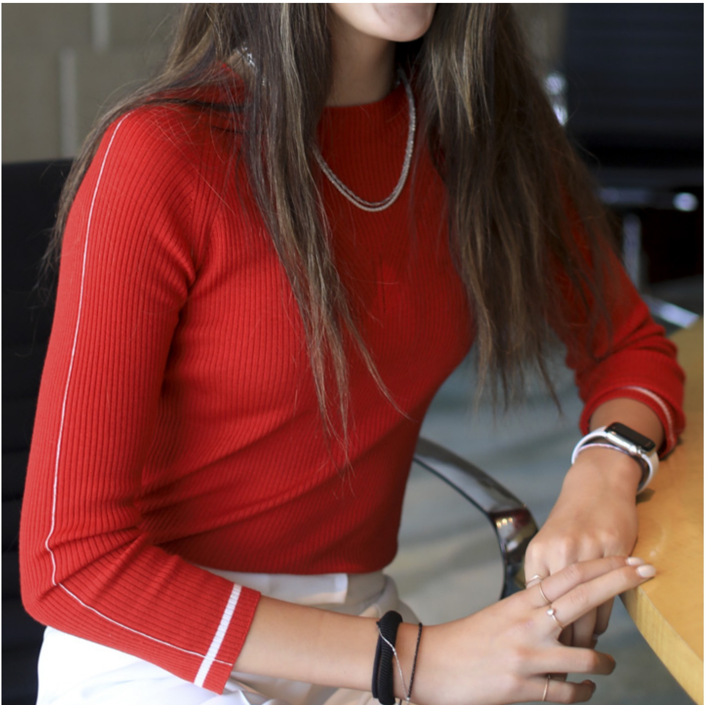
2019年7月23日，谷爱凌在北京接受媒体访问。