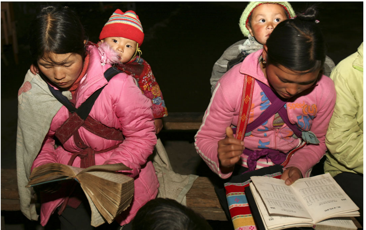
中国云南省怒江傈僳族妇女带著婴儿在读经。

首先，如果“八孩母亲”真的来自福贡县，那么这个跨越了数千公里的人口贩卖故事就确实有可能成立。福贡县的傈僳族山区有非常大规模向东部沿海地区输送女性人口的历史。比如陈业强访谈了一个两千多人口的村，三十年间有103名女性离开村落外迁——包括被拐卖。这是个相当不可思议的数字。毕竟福贡就算到云南省会昆明也有近700公里路程，如果不走高速公路甚至需要17个小时。