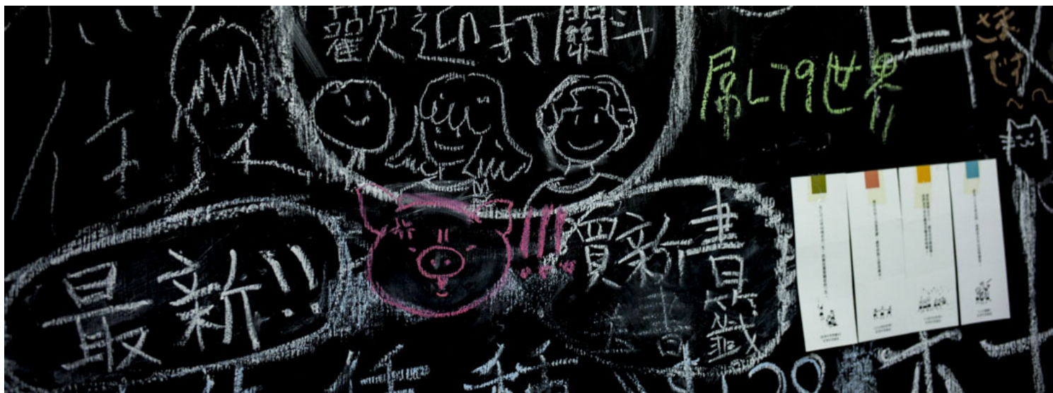
好青年茶毒室内的一幅写满字的黑板。

这个群体的意义，突破了单纯的围炉取暖。打开群组，除了闲聊，竟有并非哲学专业的室友就各类议题，例如音乐、建筑等交流，更会为此制作简报，甚至以论文分享心得。“好癫，大学都做不到啦，你一进去，有一班人在简报。”甘仔道。