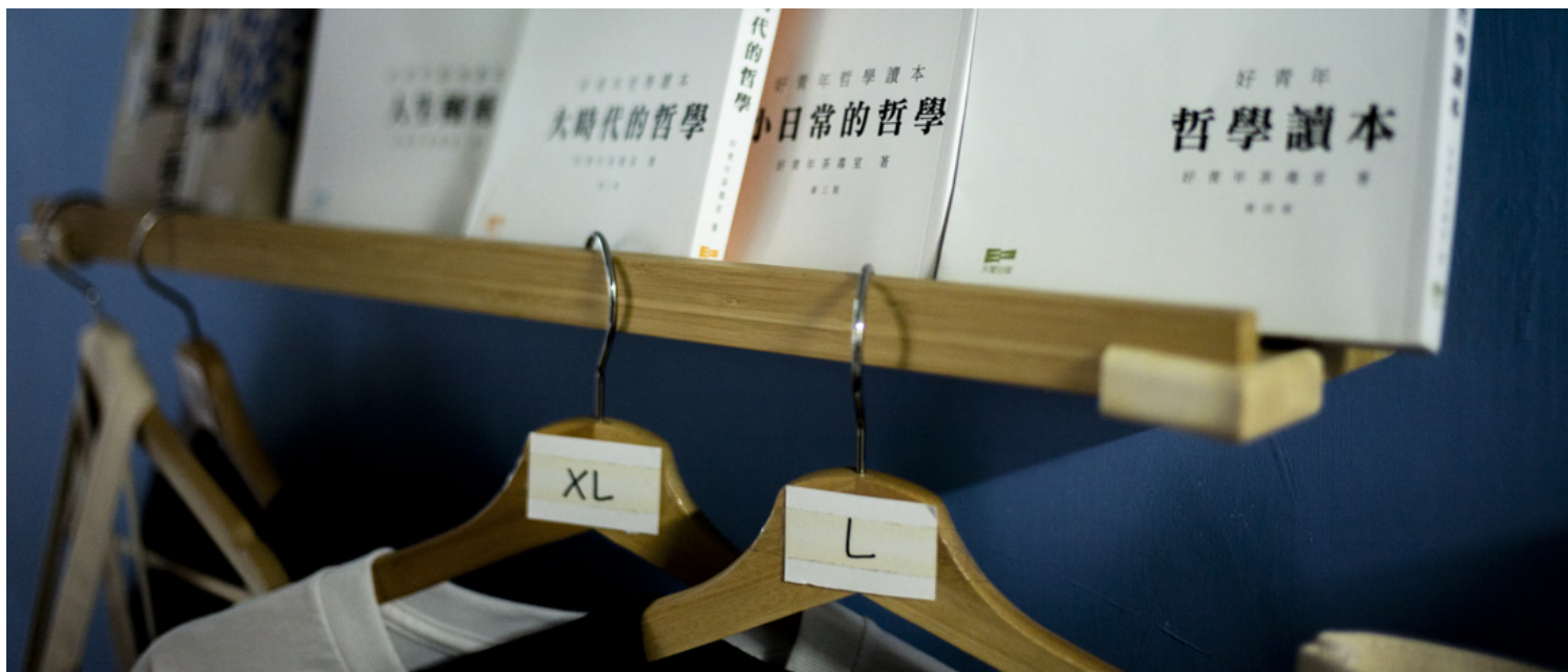
好青年茶毒室的出版物。