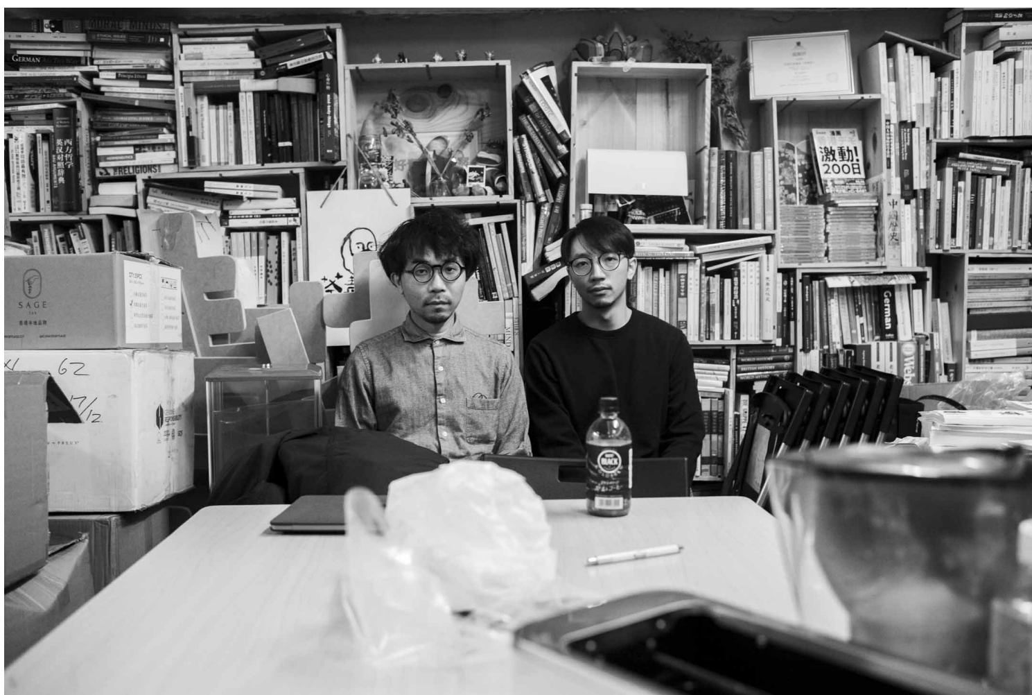
好青年茶毒室创室成员甘仔与四哥。