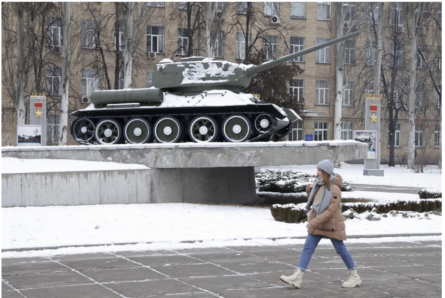
2022年1月25日，乌克兰基辅一名年轻女子在户外纪念展览上走过一辆二战时期的苏联 T-34 坦克，该展览是庆祝苏联在二战期间对抗纳粹德军的胜利。

在欧洲内部，这种冲突表现为“自主”的戴高乐路线和继续维护美国主导的“大西洋主义”之间的冲突。而放到今天看，这样的冲突和华府尤其是拜登政府自身的困境互相激发着：如果我们看美国极右翼如何评论此次的乌克兰危机的话，会发现他们大多数谈到拜登儿子的“通乌门”，并且认为这是“俄罗斯自己的事情”。于拜登而言，乌克兰危机是他在2008-2014年副总统任期上的“政治遗产”，无法坐视其主导权回到莫斯科手中。而它同时也是美国自由派维护的自由主义秩序和右派试图重塑的更孤立主义的路线之间的较量。这样才能够解释，为何在美国朝野都认为北京才是主要对手的当下，从拜登到自由派的媒体都要大力渲染俄罗斯对欧洲的威胁——毕竟这样并不符合“集中力量针对主要对手”的教条。乌克兰危机的存在难道不会令美国在台海更分心吗？但如果美国不在欧洲存在，在其他地方的存在就更没有意义了。