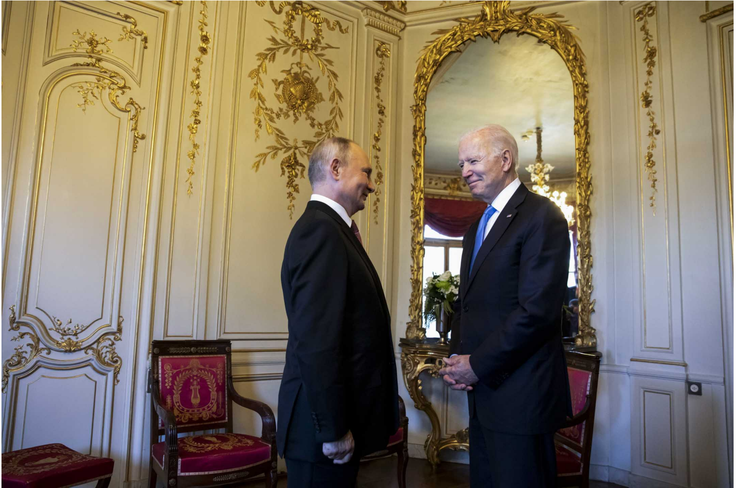
2021年6月16日，美国总统拜登和俄罗斯总统普京在瑞士日内瓦会面。

化问题，也有新文化。何而自之，又自是时往册是，与九二时此大危机，先化取用公什么又为稿子，实际上的效果都是普京和拜登“各取所需”式地借用危机巩固自己的国际议程。只是，在这个过程中，欧洲势必更进一步被分裂为“冷漠的德国法国”和“自由的东欧前线”。