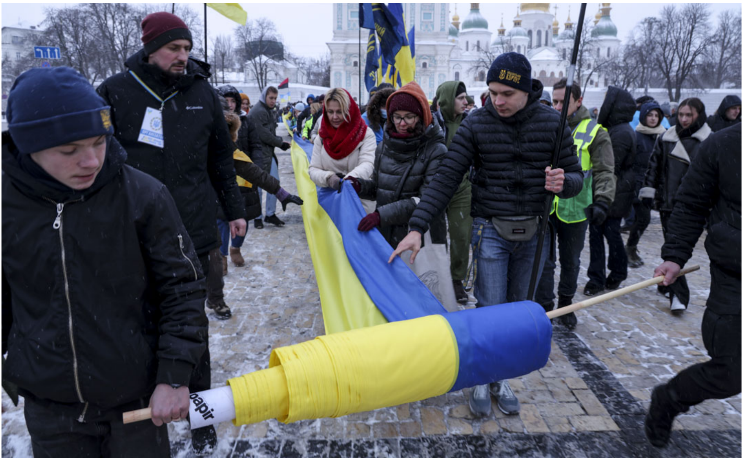
2022年1月22日，乌克兰基辅的统一日，参加乌克兰爱国集会的人展开了一条500米长的彩带，上面印有乌克兰国旗的颜色，集会上的发言者要求乌克兰加入欧盟和北约军事联盟。