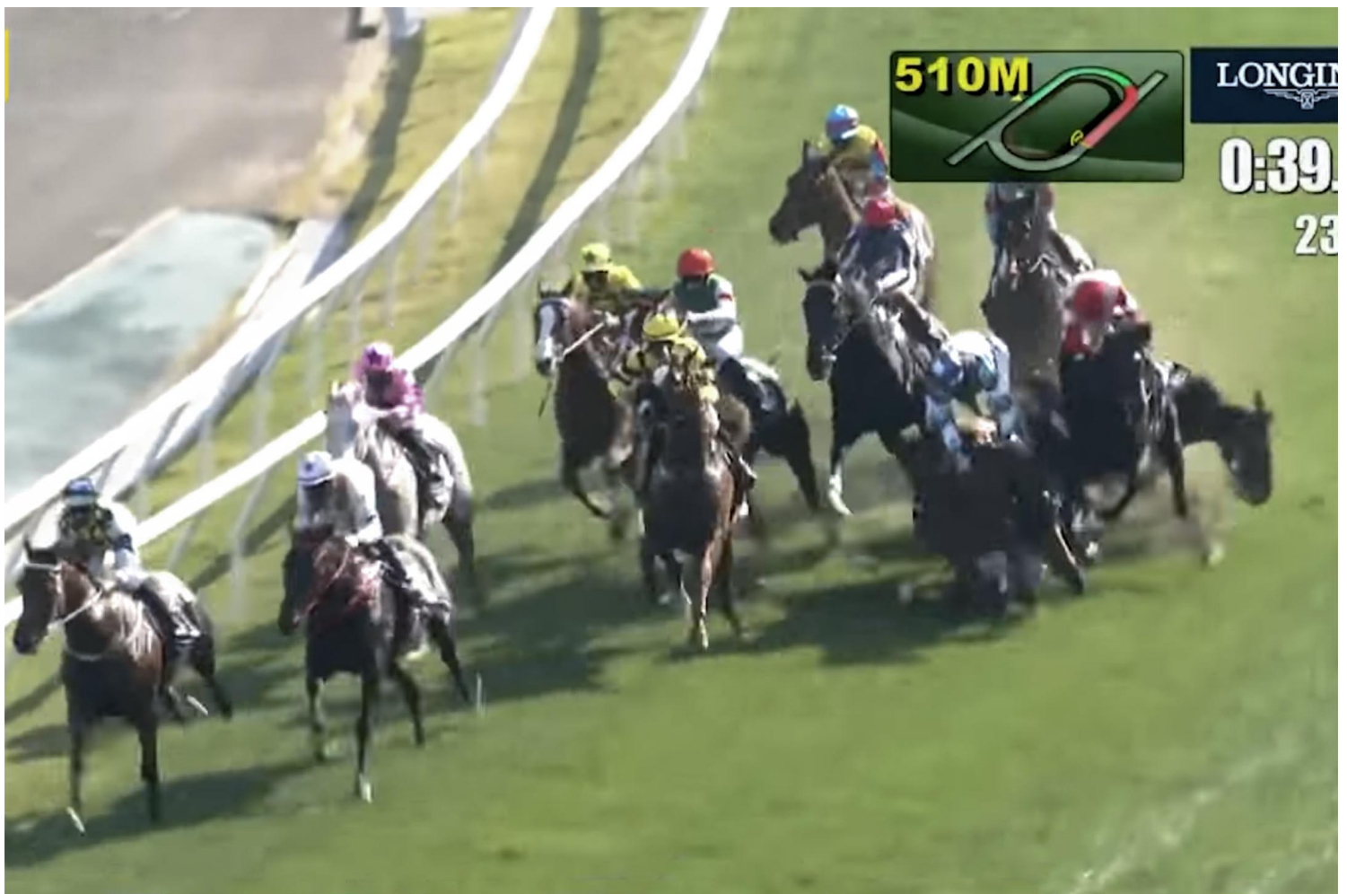
2021年12月12日香港沙田马场，国际一级赛1200米香港短途锦标赛，其中9号“君达星”在过弯入直线时失蹄，导致4名骑师坠马，“君达星”与8号“肥仔叻叻”受伤，最终遭人道毁灭。

两宗事件的另一个相似之处在于官方用字，香港叫“人道处理”，大陆叫“无害化处置”。“处理”和“处置”都含糊，字面上不知实际意思。说要把仓鼠“人道处理”，不知脉络还以为政府要好好照顾牠们。只可惜“处理”方式是扑杀，这反映出政府只想找出最方便快捷、节省成本的方法处理问题。当问题牵涉动物，“处理”了动物就处理了问题。然而，快不等于好，便宜不代表妥善，尤其牵涉上千条生命，更加应该审慎。在只求效率的思维模式下，被牺牲的往往是无力反抗的弱势。即使有其他可行方案，动物仍被扑杀，可见牠们被牺牲并非为保障公共卫生，而是成本计算的结果。