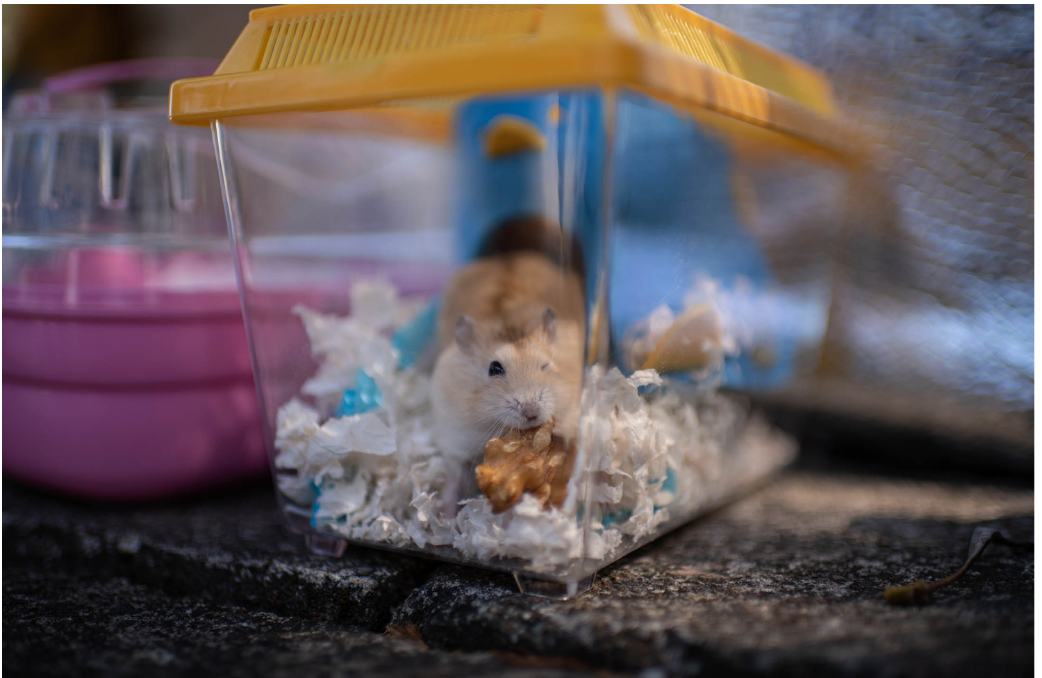
2022年1月20日，一只仓鼠在香港新界南动物管理中心外被志愿者收养，并说服主人将仓鼠交给政府。

我一直觉得“人道毁灭”此说法不好，“毁灭”是对死物的，对动物就是“杀”，应老实点。结果现在改称“人道处理”，连实际意思都要隐瞒。用字的不同会影响人的道德情感，普遍而言，“杀”很差，“毁灭”不好，“处理”则无特别。硬把“扑杀”说成“无害化处置”或“人道处理”，不单是漠视生命，更是颠倒是非、操控情感的表现。