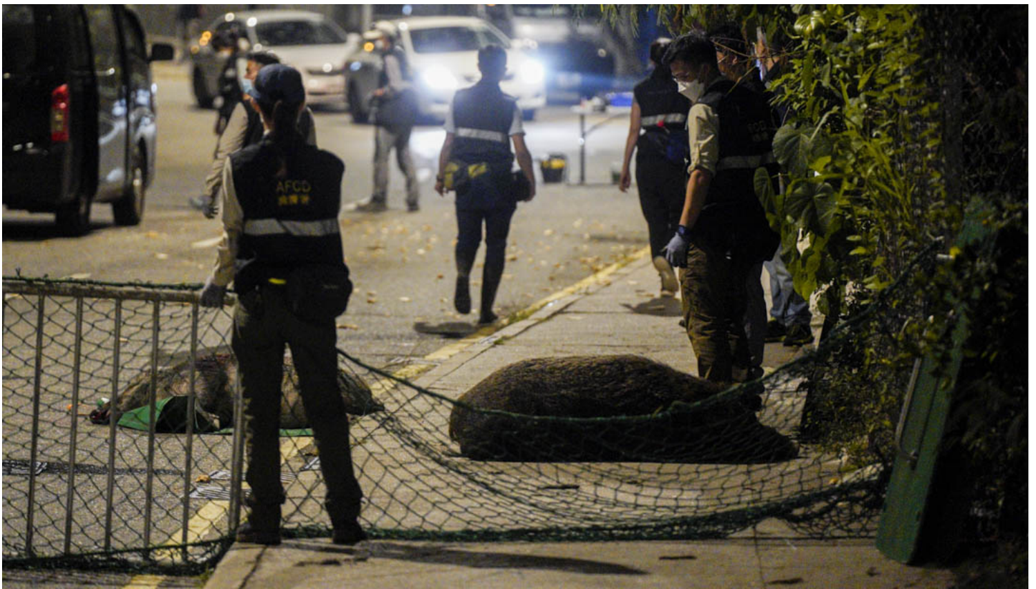
2021年11月17日，渔护署于香港仔深湾道进行野猪捕捉行动，由兽医利用麻醉枪捕获七头野猪，并利用药物注射作人道毁灭。

大家当然同意野猪不是宠物，也反对“宠物化”野猪，但看看近日仓鼠的处境，就知即使是宠物，也未必有好下场。