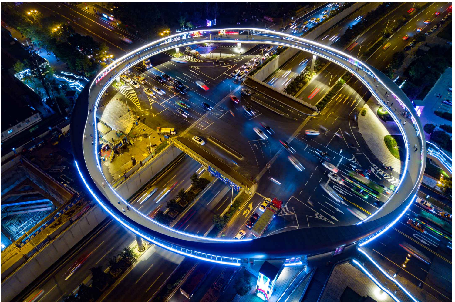
2021年6月29日中國西安，一座圓形行人天橋。攝：Li Hui/VCG via Getty Images

今年真的是互联网行业大变动，百度裁员、快手裁员、头条裁员，即使现在裁的不是自己，谁知道哪一天头上的铡刀不会落下呢，关键是经济下行的今天，互联网真的要冬眠了，不知道前路何方，不知道自己应当走哪天路，原来互联网还没等到我们35岁就要解体。