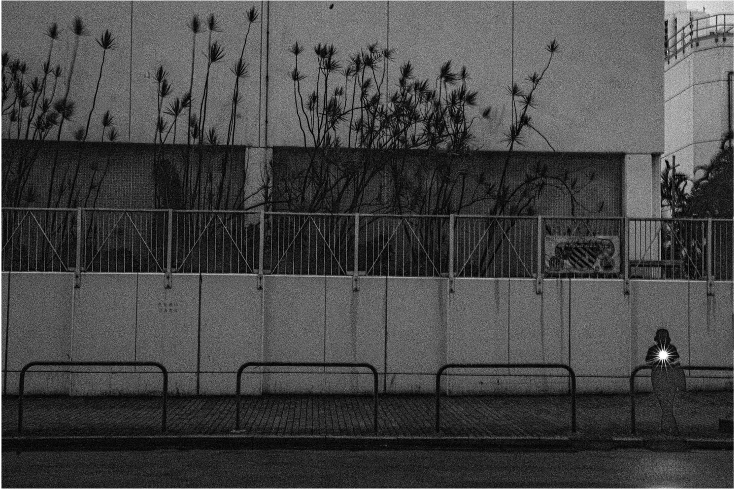
2021年6月21日香港西九龍裁判法院，一名送行的人在法院外亮起手機燈送別被捕的示威者。