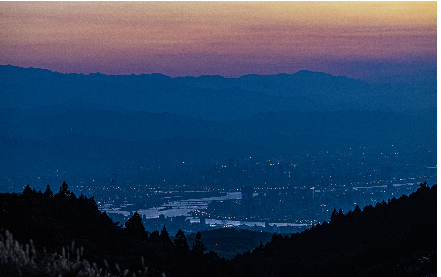
2021年11月12日台灣台北市。