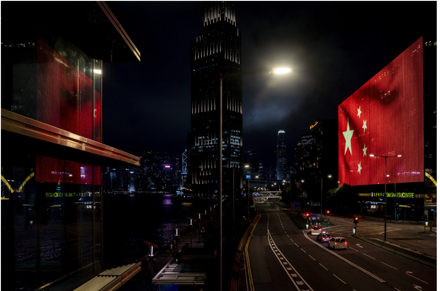
2021年6月29日，尖沙咀中心外牆亮起一面大型的中國國旗。

2021年，适应疫情常态化，谨慎从事发展工作，好好读无用之书，坚持融入日常的锻炼，认真过好独居生活，去创造更真实的“附近”：在一个用恨发电的时代，联合了一些志同道合的伙伴，进行了一次用爱发电的公共尝试。回顾1月份时在社交媒体写下的文字：“不要麻木，不要犬儒，拥抱生活和身边的人与事，自勉之。”总算对得住当时的自己。分享本年度我听过最酷的一句话：“我道德感比较强，很多事情我做不到。”——来自大陆的漂流瓶