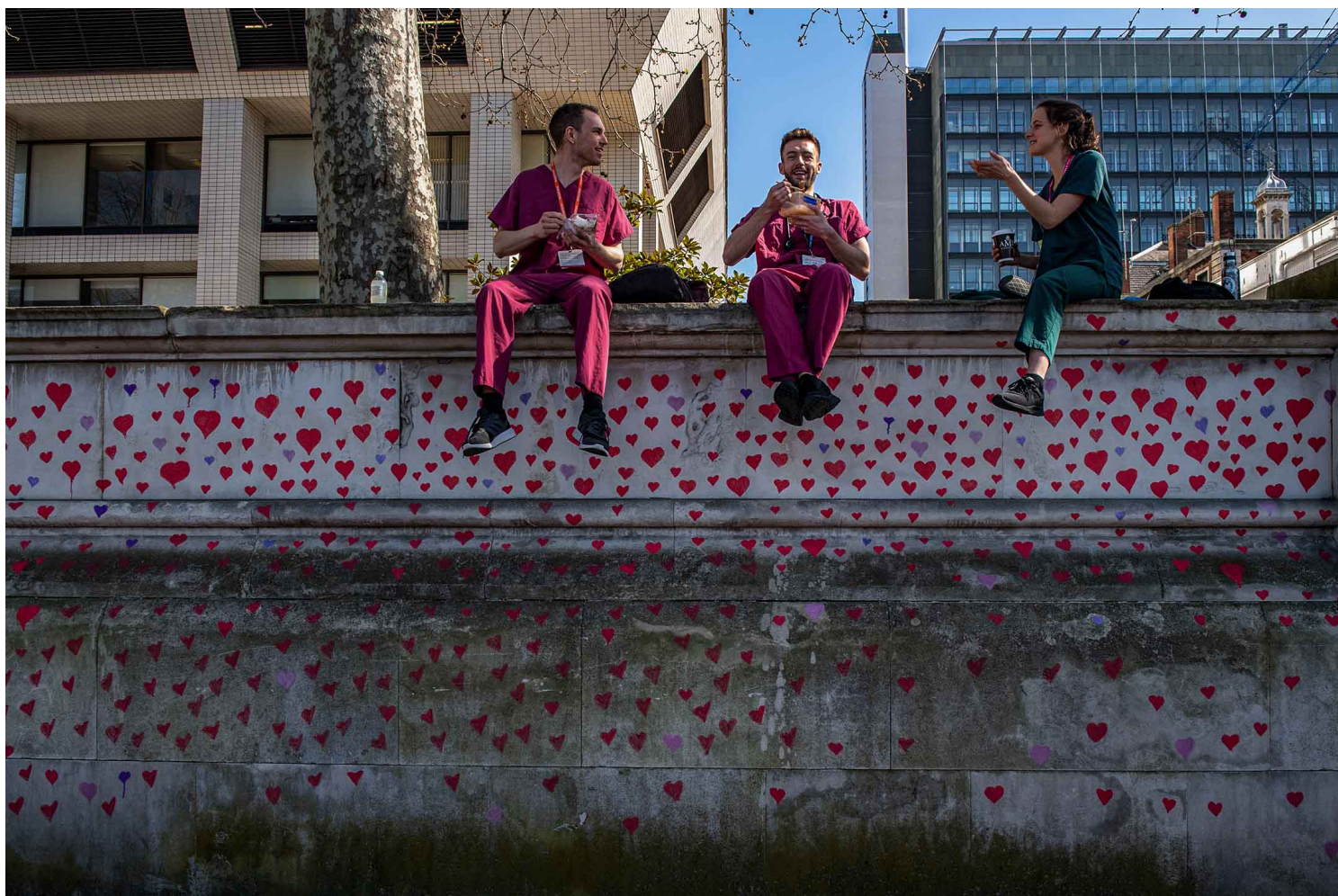
2021年3月29日英國倫敦，工作人員在2019冠狀病毒紀念牆上吃午餐。

回顧2021的時候才恍然發現2020似乎一閃而逝，連一道薄薄的影子都未留下，似乎被什麼人什麼事偷走了一年。2021也過得飛快，轉眼間大學生活即將走到尾聲，竟無有任何值得回憶或者留戀之事。向前看、向前看，唯有如此才能感受到生命尚有一絲希望。