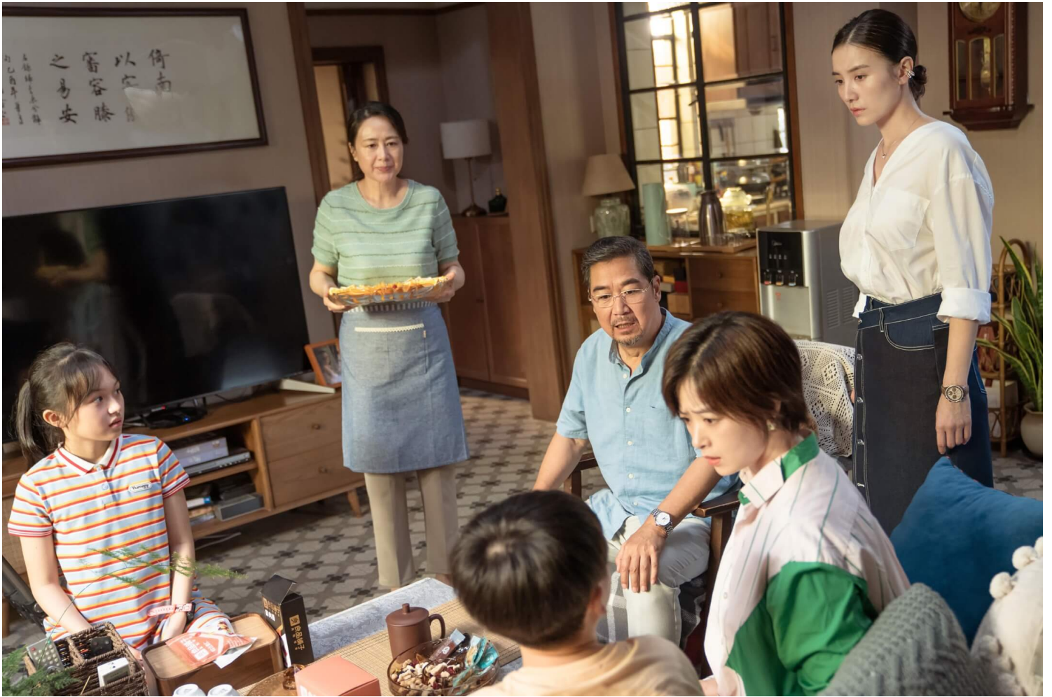
《小舍得》剧照。网上图片