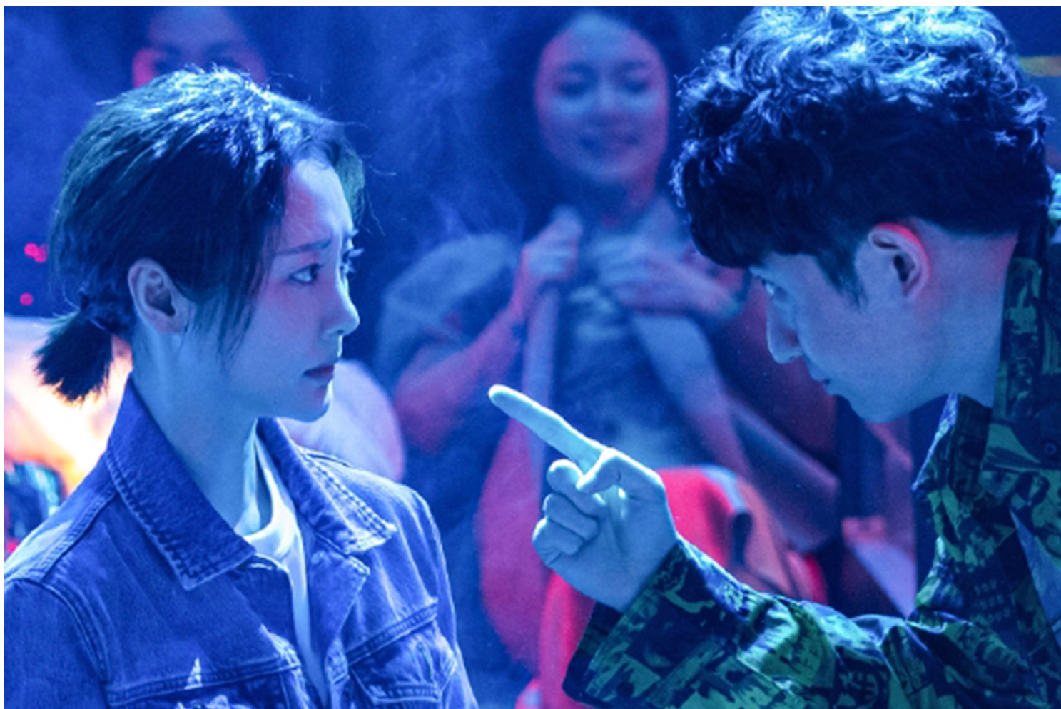
《爱很美味》剧照。

该剧的主角是三位30多岁的女性，她们或者单身，或者失婚，或者在一段不匹配的爱情中，但都没有让她们失去爱的勇气，想要努力找回自己丢失的自我。《爱很美味》以美食切入对爱情和欲望的讨论，其中的女性从不避讳对身体欲望的追求，她们有独立生活的能力，希望找到有责任和自己一起承担生活的男性伴侣，而不是寻找一张长期的饭票。