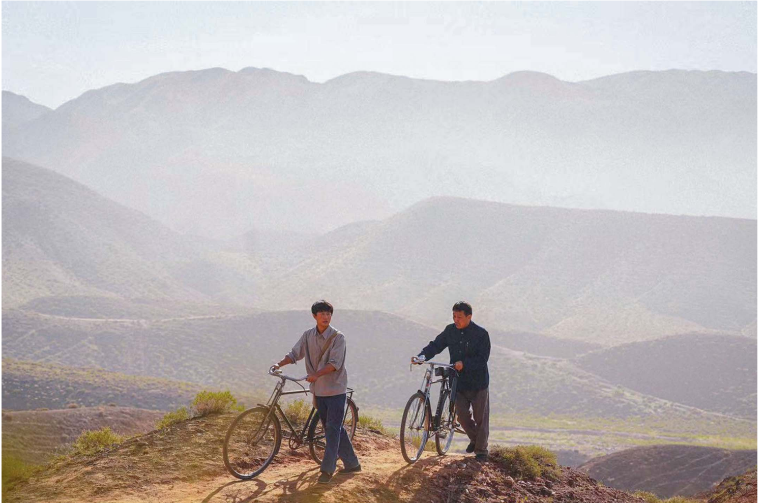
《山海情》剧照。

以下讨论的内地剧集论质量或参差不齐，却能反映过去一年其生产地与接受地的某些面向——关于观看者自身的经验，也关于观众借此的自我审视。