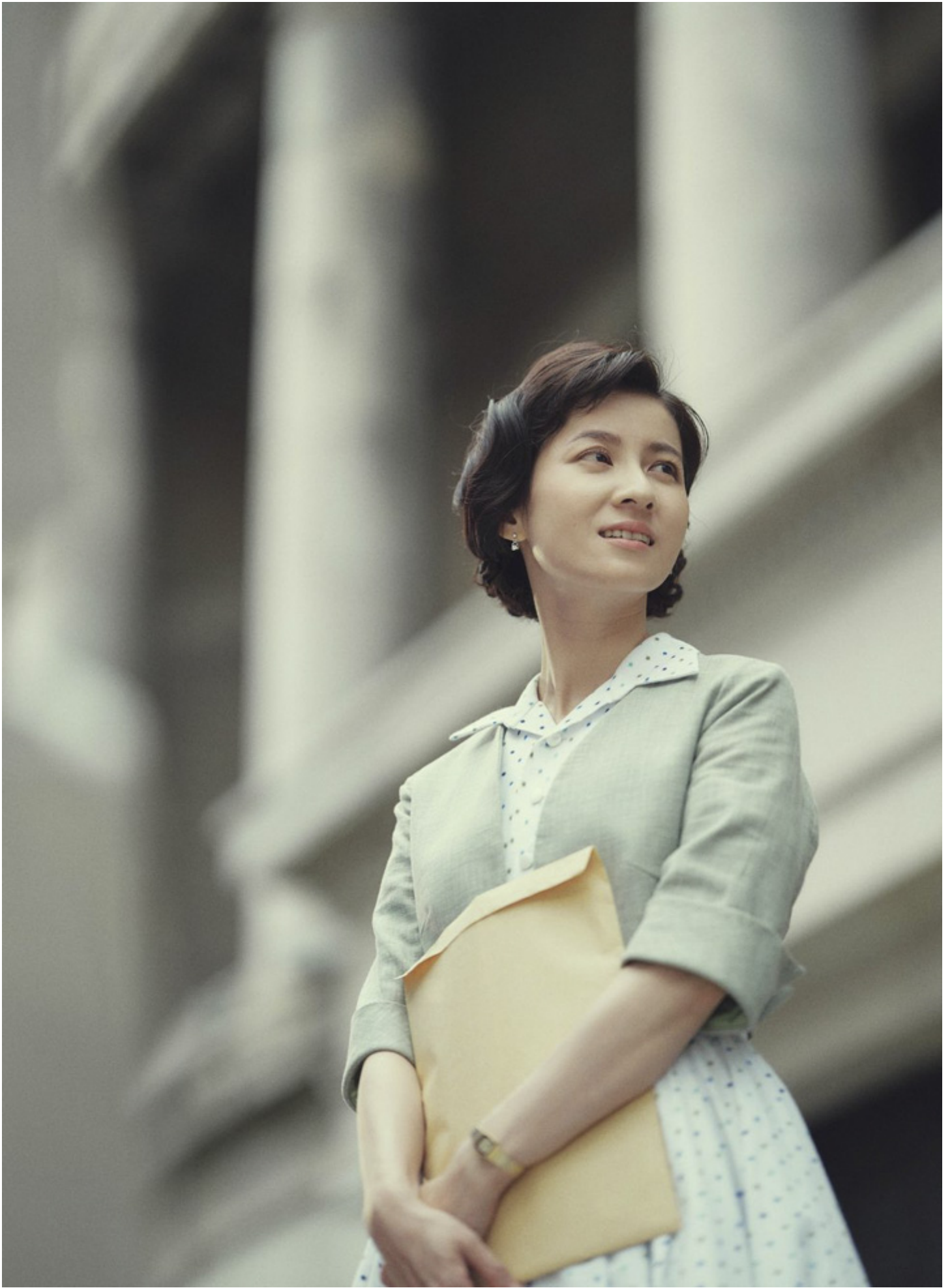
《茶金》剧照。