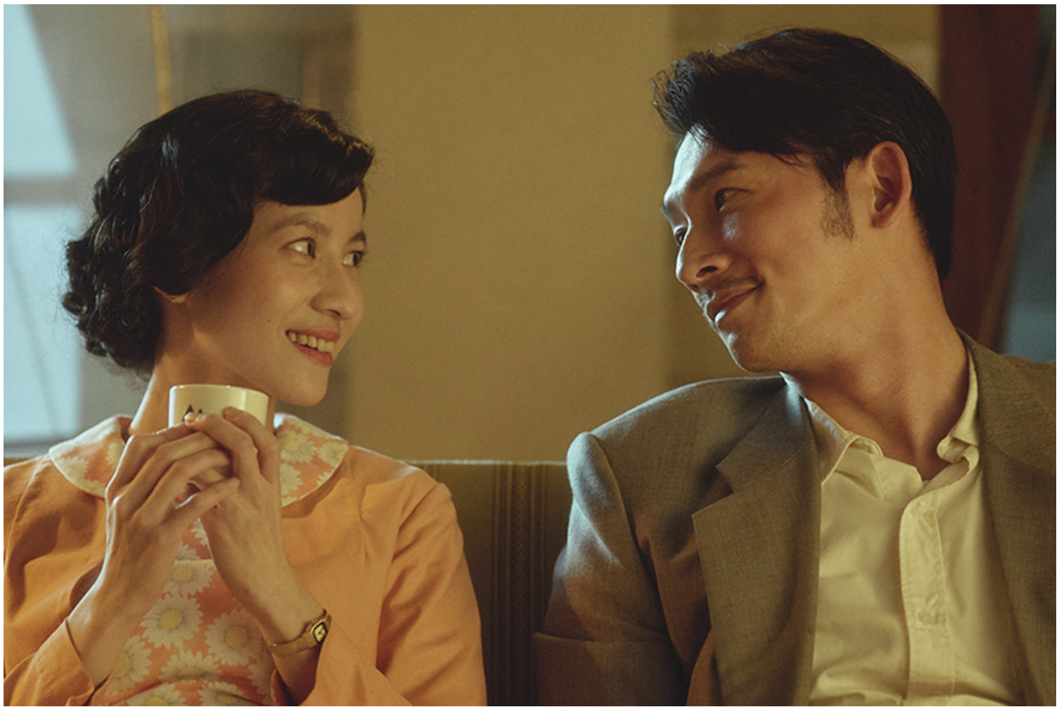
《茶金》剧照。网上图片