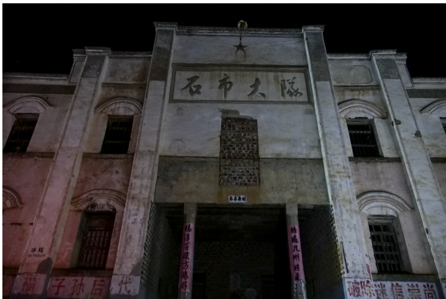
夜晚的石市大队。

她们很快就毕业了，有人上了初中，有人辍学了。有的忙着劳动挣工分，有的当红小兵。她们不知道自己“交代”的材料，后来成为老师“犯罪”的证据。