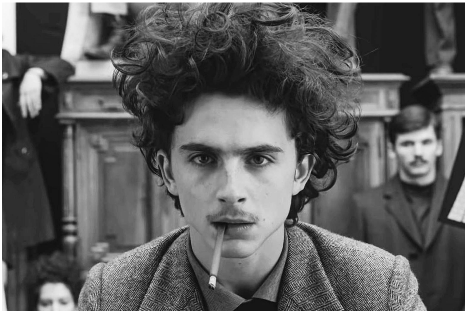
《法兰西诸事周报》剧照。

乘机借在鬼门关来回了一转的大厨之口，带出了旅法异乡人的感怀和况味；跟第二段相似，超现实框架提升了闹剧的背后信息，令观众一下子体会出“异乡人”的存在主义指涉。