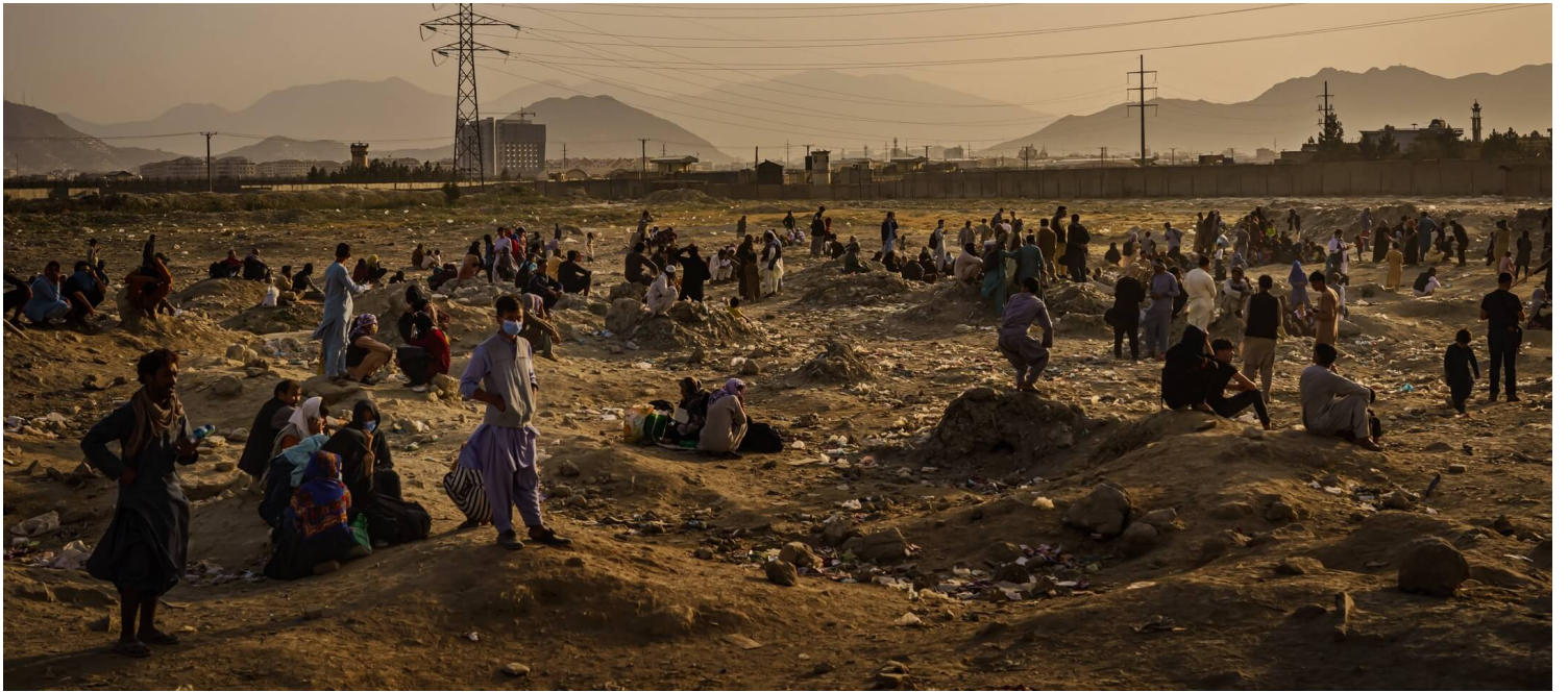
2021年8月23日，阿富汗首都喀布尔，没有赶上登上美军军机的阿富汗人民在机场外聚集，远处有一辆美军军机起飞。