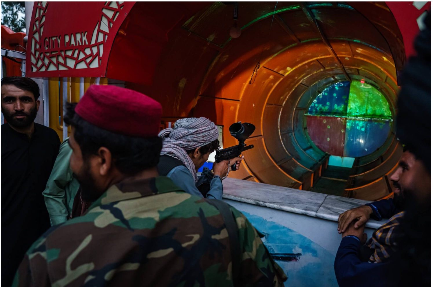
2021年9月11日，阿富汗首都喀布尔，塔利班战士在市内一个主题乐园玩摊位游戏。