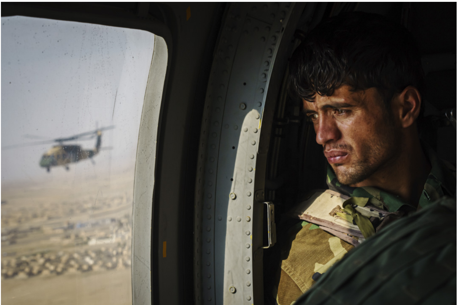
2021年5月6日，阿富汗城市坎大哈，一名士兵在一辆进行补给任务的UH-60黑鹰直升机向窗外望。

Marcus 最早于2017年开始首次到访阿富汗。美国于今年5月宣布从阿富汗撤军，当地局势紧张，过去一年他分别3次来到当地采访，整体留在阿富汗的时间共4至5个月，喀布尔陷落前的一天，Marcus 再次抵达。