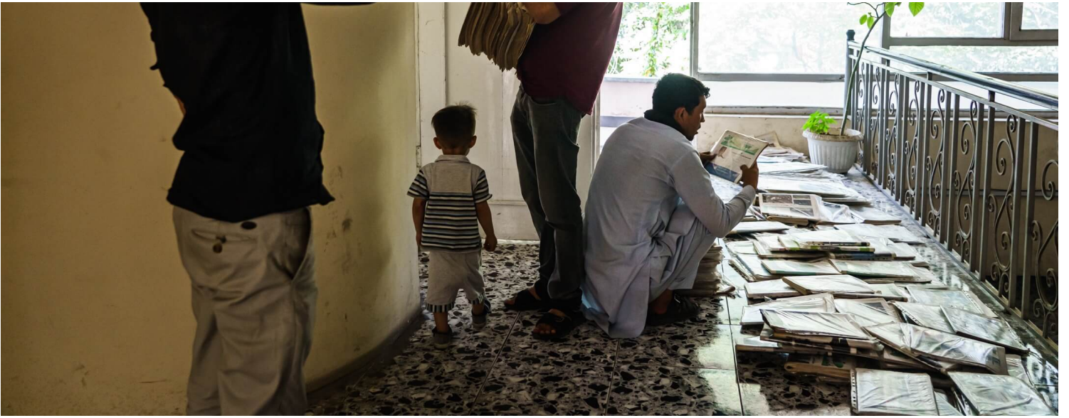
2021年9月16日，阿富汗首都喀布尔，Etilaat Roz报社办公室搬迁，员工收拾往期报纸档案本。