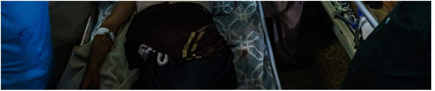
2021年8月26日，阿富汗首都喀布尔，家属到医院探望早前在喀布尔国际机场炸弹袭击中受伤的亲人。