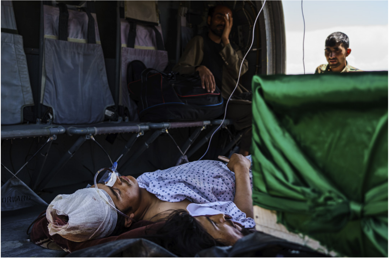
2021年5月9日，阿富汗加兹尼省，一名受伤的士兵被抬上一辆UH-60黑鹰直升机。