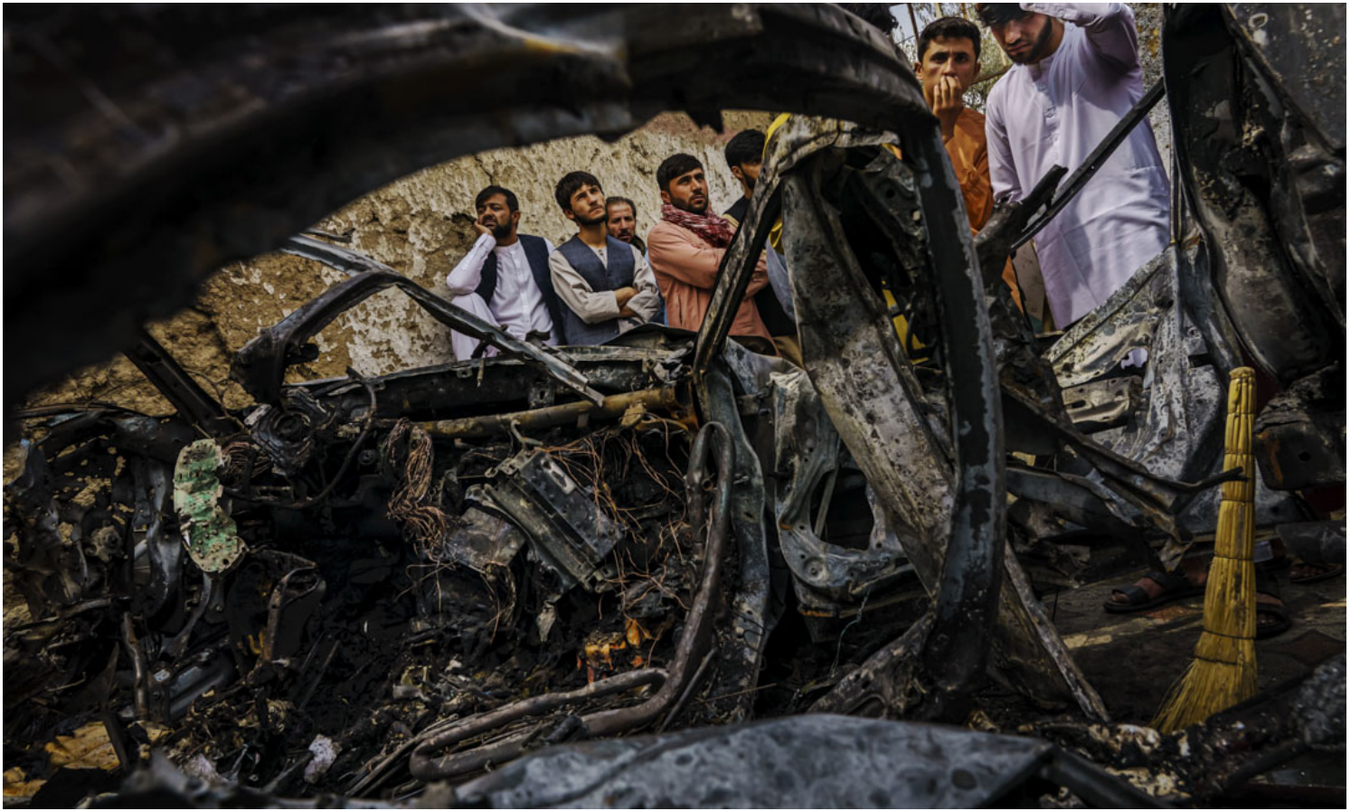
2021年8月30日，阿富汗首都喀布尔，市民围观一辆被美军无人机空袭摧毁的车辆。