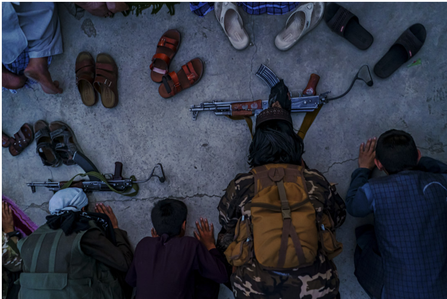
2021年8月26日，阿富汗首都喀布尔，有塔利班战士与市民一起祈祷。