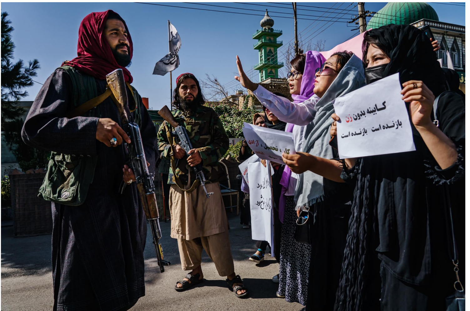
2021年9月8日，阿富汗首都喀布尔，示威者到街头抗议新成立的塔利班过度政府只有男性，没有女性或少数族裔代表，有塔利班战士阻止游行队伍往前进发。