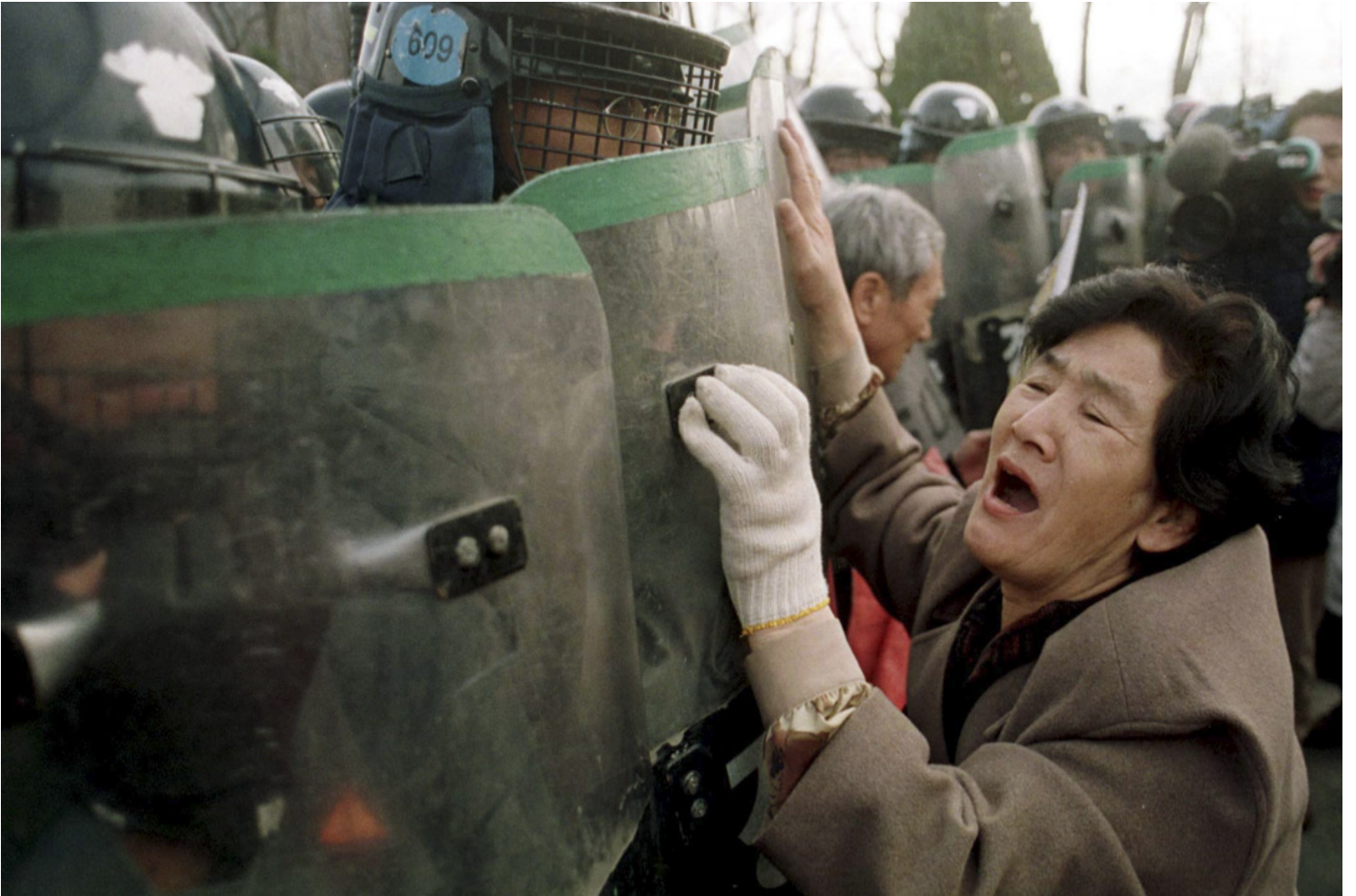
1997年12月22日，全斗焕特赦获释后坐豪华轿车离开监狱，一名韩国妇女向车中呼叫。

而在全斗焕执政的第五共和国时期，无需法律、随意禁书抓人的事比比皆是：1984年，日月书阁出版社翻译出版了美国小说《the Circle》韩文版，该书是知名通俗文学作家、好莱坞编剧史蒂夫·沙甘（Steve Shagan）1982年在美国出版的，讲述韩国总统朴正熙被刺杀及其引发的全斗焕政变的惊险谍报、侦探、冒险故事。全斗焕在书中被描绘成一名阴险狂热的佛教徒独裁者，同时是虐待女性的色魔。不过，尽管美国是韩国头号盟友，作者对直接点出全斗焕的名字仍有顾虑，因此将其改称“Chung将军”（全斗焕的姓的英文拼法为Chun）。该书韩文版译者金滋东后来回忆，“全斗焕政权时期，这本书一出版，出版社社长、总编、我三人就被带到南山（中央情报部，当时已更名为国家安全企划部，笔者注）。但是出版社社长很机灵，书只被没收了200本，剩下的很多都卖出去了。三人被交付简式审判，在拘留中度过了一段时光。”1991年，该书终于在韩国出版了全译本，封面设计更是几乎“画公仔画出肠”：女主人公左右两边，分别是酷似朴正熙和全斗焕的两个男人的肖像画，不过全斗焕当时还在世，因此只画出了他的招牌秃头式轮廓，脸部则被一个大问号盖住（中国1988年也出版了该书中译本，书名《邪恶》二字嵌在封面一个男人光秃秃的后脑勺上，但他的名字被改为X）。