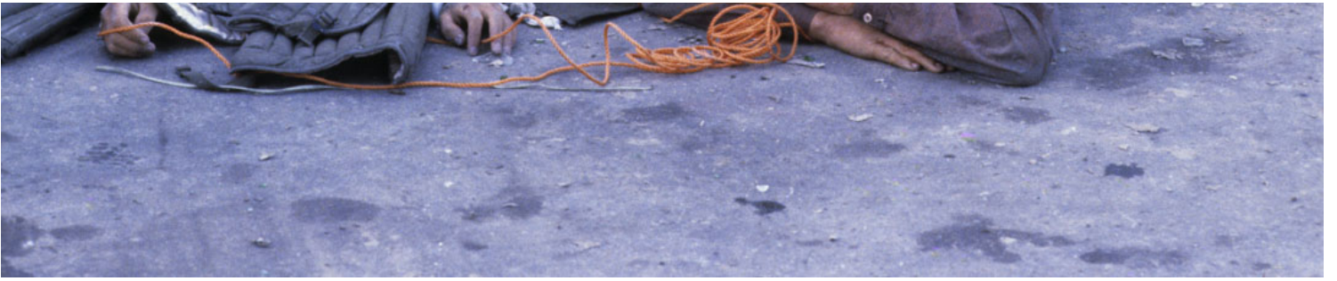
1980年5月，光州事件，掌握军权的全斗焕下令以武力镇压运动，造成大量平民和学生的死伤。

尽管如此，1987年3月美国韩文报纸《独立新闻》报导称，1984年全斗焕就委托人制订了一份“长期执政报告”，谋划退任后“全斗焕任执政的民正党总裁、总统任副总裁”继续执政至2000年，这条真假未知的消息很快传回韩国，但随着全斗焕1987年7月10日辞去党总裁职、1988年2月24日卸任总统、次日他以前总统身份就任新设立的国家元老咨询会议议长，但一个多月后就因弟弟全敬焕受贿丑闻而辞职，这些关于全斗焕“退而不休、垂帘听政”的传闻就不攻自破了，无论别人怎么说，客观上他确实做到了到期退休。而由他开创的韩国总统只任一届的先例，也载入了从他卸任之日起实施的第六共和国宪法，迄今已有34年！此外，尽管“6·29民主宣言”是由他的接班人卢泰愚对外公布，但如果他不接受也是不可能实施的。这可谓他平生最正确的决定，也是留给韩国政治的一笔正资产。