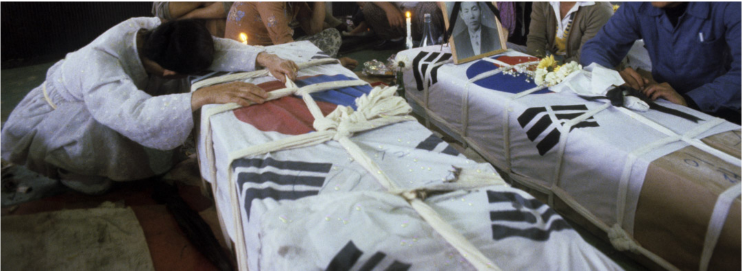
1980年5月，光州事件，掌握军权的全斗焕下令以武力镇压运动，造成大量平民和学生的死伤。

他在遗书中还说，“我早就想好了，如果能忍受苦痛就熬，熬不住就走呗。”其实，如果他自杀未遂而看到网民对其遭遇的新闻评论，恐怕会更加痛不欲生。在韩国最大的门户网站暨搜索引擎Naver上，网民的留言并非一面倒的同情、悲伤，反而有不少人幸灾乐祸地点赞，还有人质疑：“既然李某半身不遂，他是怎么样从益山去170多公里外的康津的？”起初我也有此疑问，后来看到另一家媒体刊登他的生前照片就释然了：他和另一位女士出庭为光州法院审判全斗焕作证，两人都坐在电动轮椅上。24日晚，JTBC电视台公开了他的遗书全文、生前治疗场面、坐轮椅作证当天受访的视频，网上的差评才少了些。另外，检索1988年多家韩国报纸对国会听证会的报导得知，他的汉字名叫李光荣（个别亦作“李光英”），当时身份是光州5·18负伤者会副会长，真乃光州之光荣！光州之英雄！