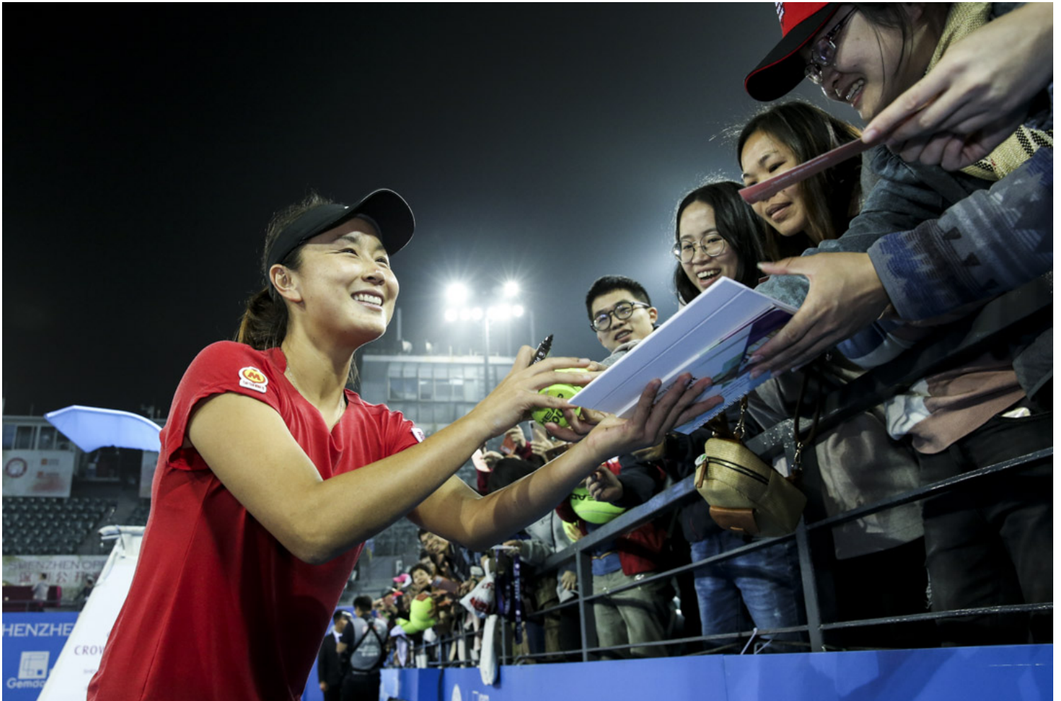
2019年1月5日，WTA深圳公开赛，女双金牌得主彭帅为球迷签名。

的态度，其早在2020年回应BBC时便表示，“考虑到奥运参与方的多元性质，国际奥委会必须在所有国际政治问题上保持中立。授予某国奥委会奥运举办权并不意味着国际奥委会认同该国的政治架构，社会状况和人权标准。”