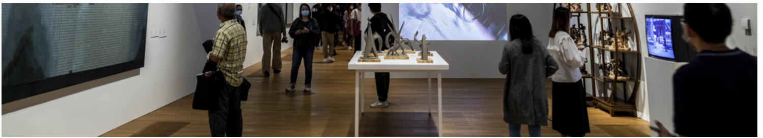
艾未未影像作品《长安街》在展厅中显眼的位置展出。