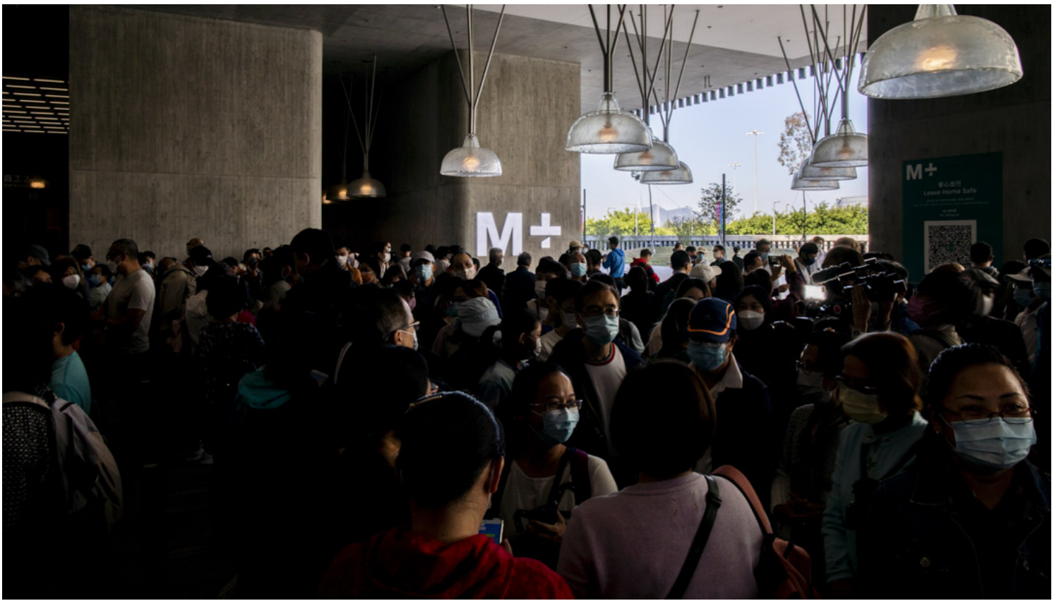
2021年11月12日，西九文化区M+博物馆正式开幕，门外轮候入场的市民。